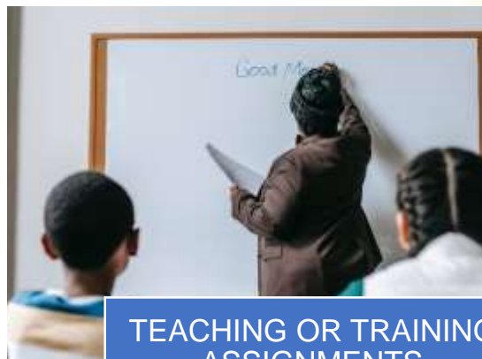
TEACHING OR TRAINING ASSIGNMENTS