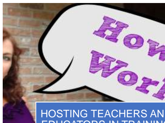
HOSTING TEACHERS AND EDUCATORS IN TRAINING