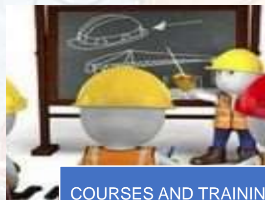
COURSES AND TRAINING